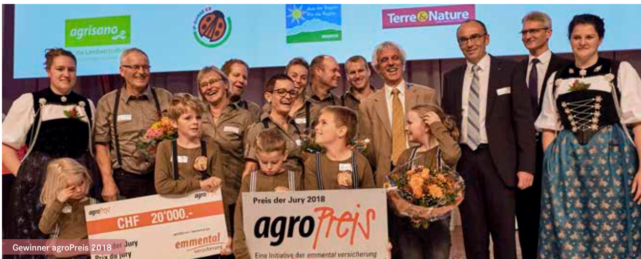
Gewinner agroPreis 2018 der Jury

Preis der Jury 2018 agroPreis Eine Initiative der emmentalversicherung