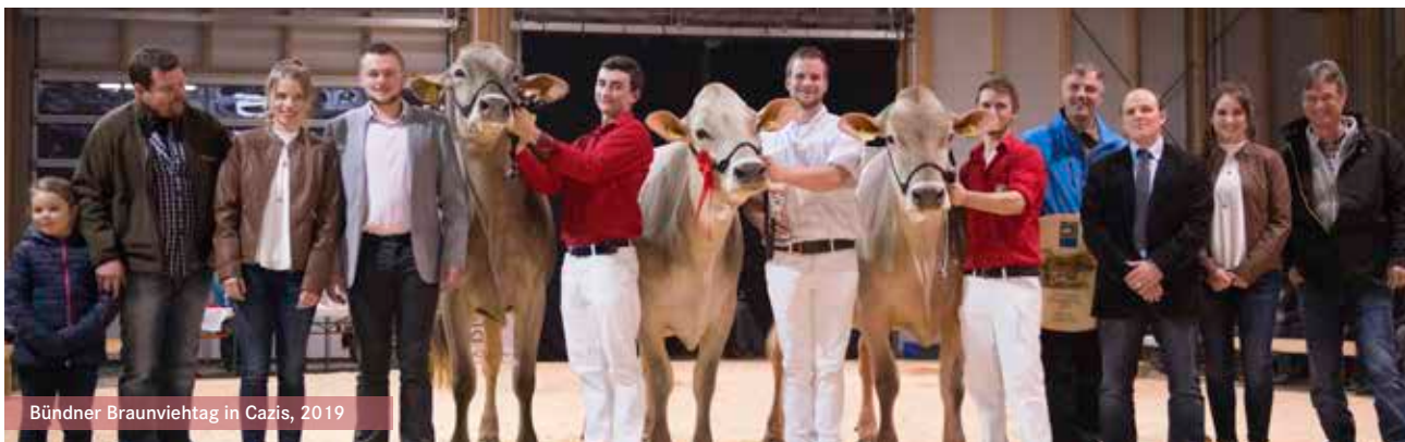
Bündner Braunviehtag in Cazis, 2019