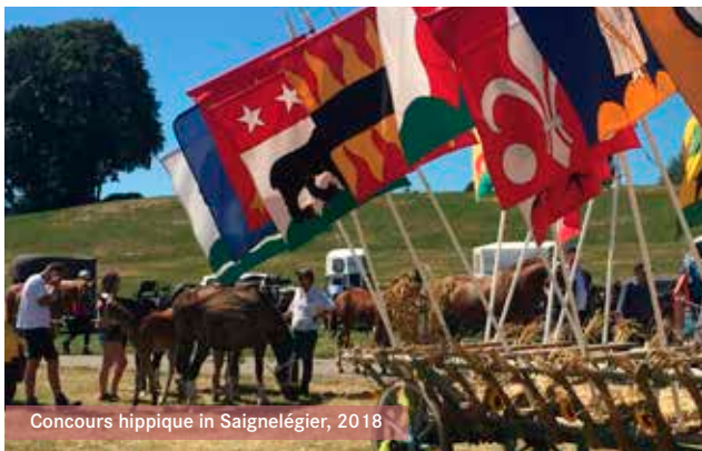
Concours hippique in Saignelégier, 2018