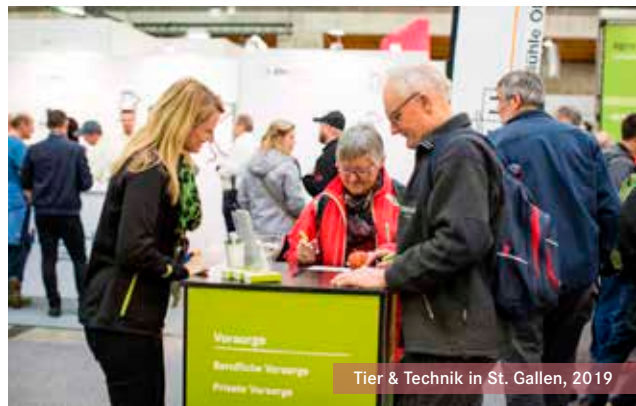
Tier & Technik in St. Gallen, 2019