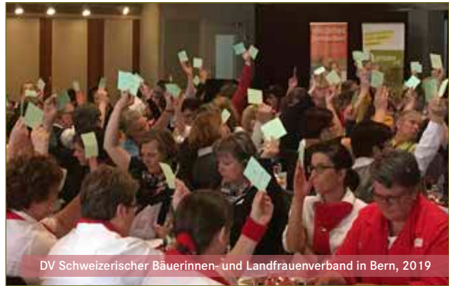
DV Schweizerischer Bäuerinnen- und Landfrauenverband in Bern, 2019