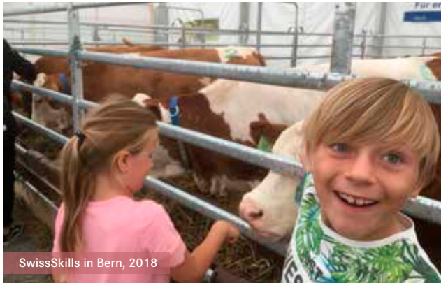
SwissSkills in Bern, 2018